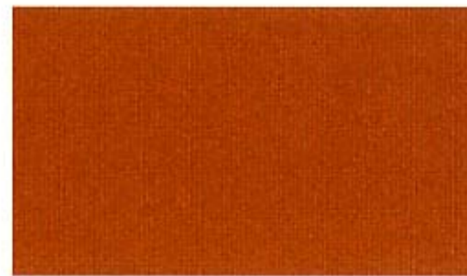
Amber Fire Metallic