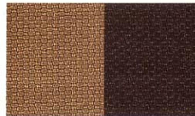
Stoff Camel/Dark Green