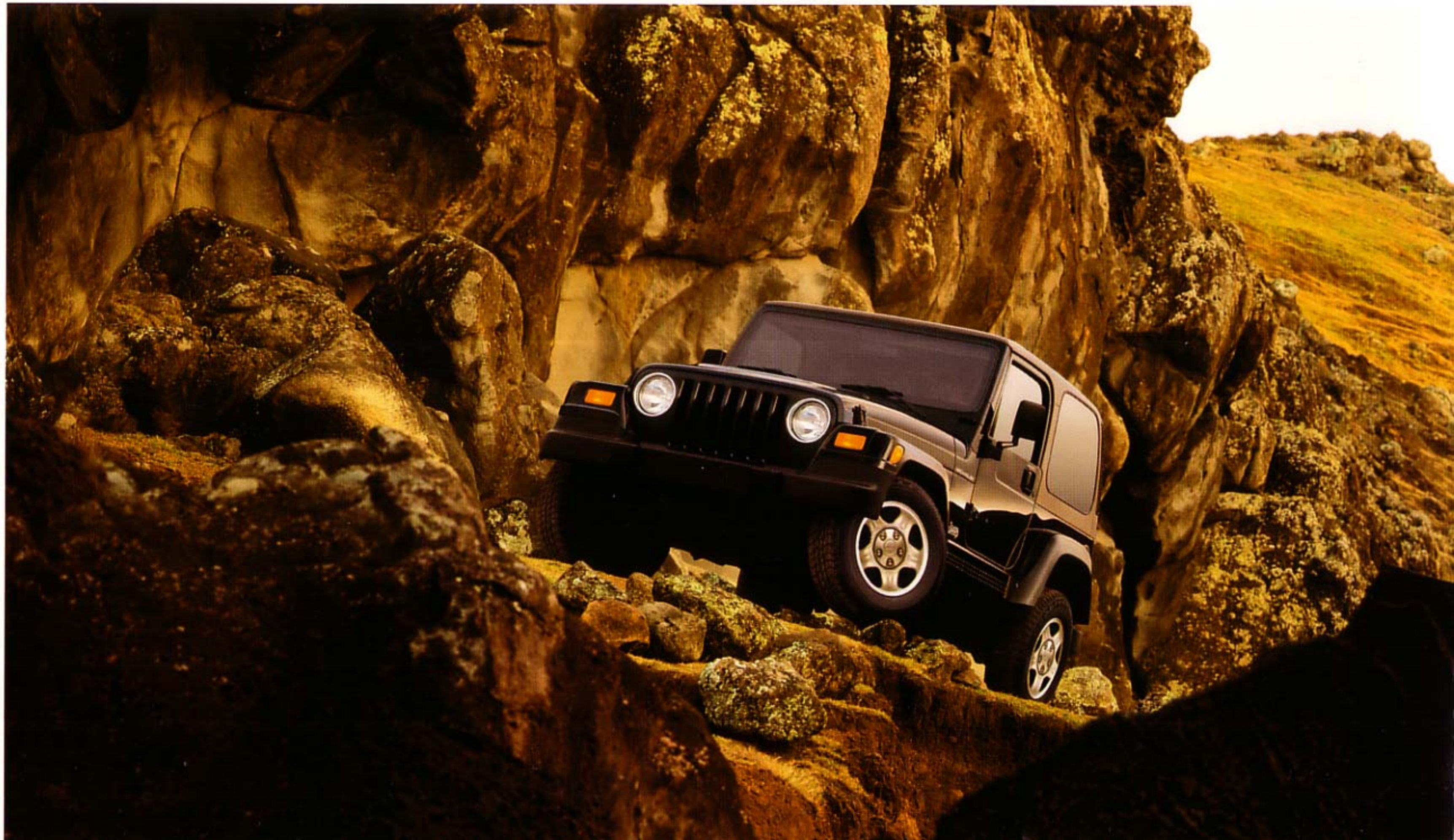
Jeep Wrangler Sport in Black.

Vor über 60 Jahren wurde der Willys MB zur Legende. Heute setzt sie sein würdiger Nachfolger fort: der Jeep Wrangler. Sein bewährtes Command Trac Allradsystem und die robuste Karosseriekonstruktion gelten unter Off-Road-Fahrern immer noch als Maßstab. Die beiden kraftvollen Motoren mit 2.5 l und 4.0 l Hubraum überzeugen durch viel Drehmoment schon bei niedrigen Drehzahlen. Und seine vielen funktionalen Ausstattungsdetails, wie zum Beispiel das serienmäßige Softtop-Verdeck, garantieren jede Menge Fahrspaß auf und abseits der Straße. Jeep, – das Original.