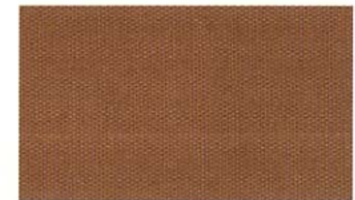
Verdeck Dark Tan